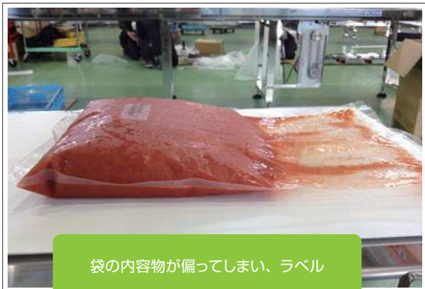
BEFORE プレスコンベヤ設置前

自動上貼りラベラー導入にあたり、充填機の上から出た後の製品の形状が偏っていたりデコボコしていたりするのでラベルの上貼りの精度が出せないため、自動上貼りラベラーを通す前にプレスコンベヤ（ならしコンベヤ）で製品を平らにしきれいに貼れるよう工夫しました。