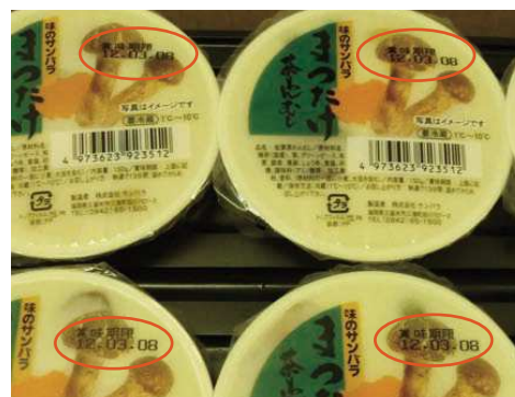
賞味期限を印字した後の上面フィルム