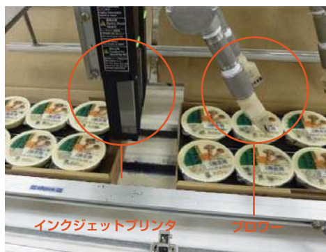
ブロー（温風）とインクジェットプリンタ