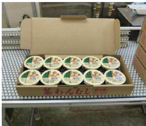
茶碗蒸しの上面フィルム

引き続き、某・茶碗蒸し製造工場より、インクジェットプリンタで賞味期限を印字する作業の改善依頼がありました。茶碗蒸しの上面フィルムに印字する際に、加工段階での温度変化でフィルムの表面に結露が付着してしまい、インクが滲んでしまう等の問題点がありました。